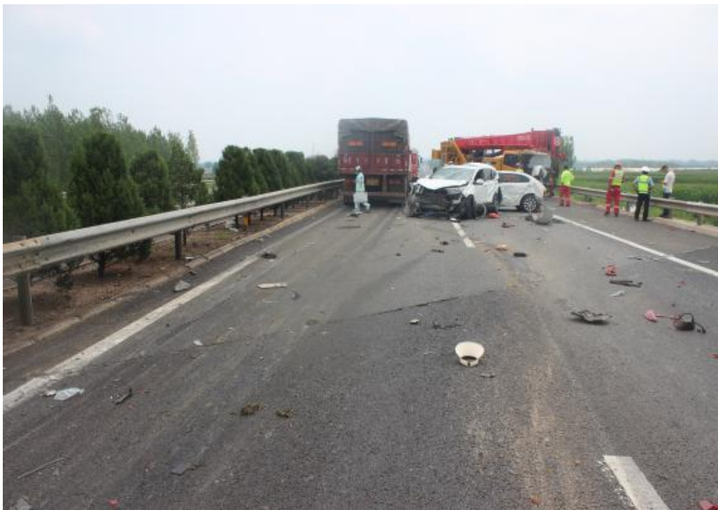
事故现场由西向东拍照