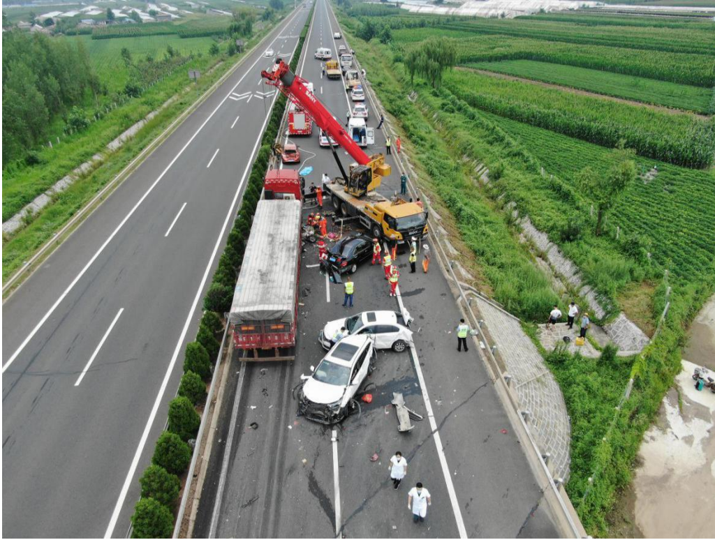
事故路段西向东航拍照